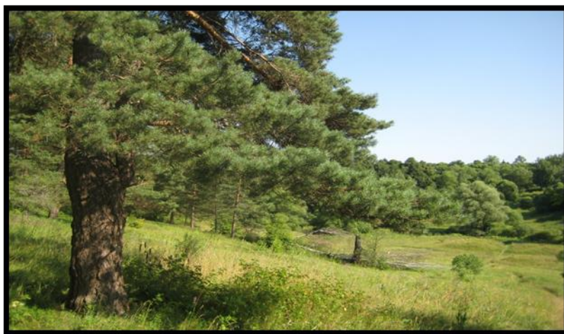
Рисунок 3. Окрестности Тарусы. Пачевская долина