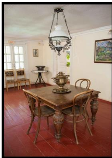
Рисунок 11. Внутренне убранство дома Тьо

«Дом в Тарусе! Он был такой единственный!» Он всем укладом своим перенесён из Швейцарии» и был «воплощением старины, неукоснительного во всём порядка».