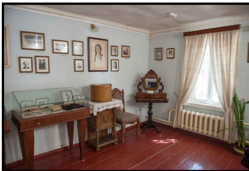
Рисунок 10. Экспозиция музея Цветаевой «Дом Тьо»