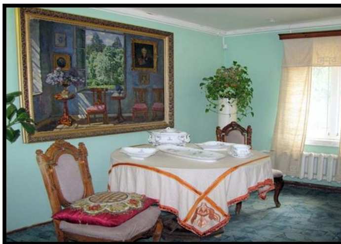
Рисунок 12. Экспозиция музея Цветаевой в Тарусе