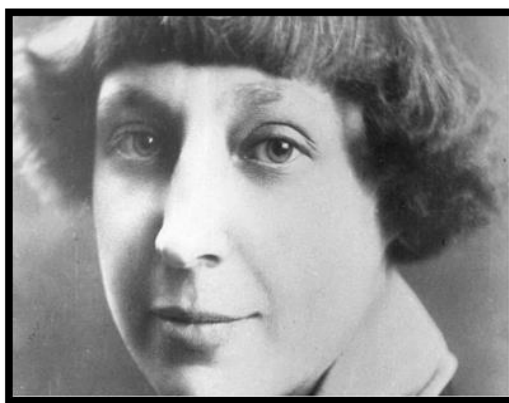
Рисунок 1. портрет поэта Марины Ивановны Цветаевой