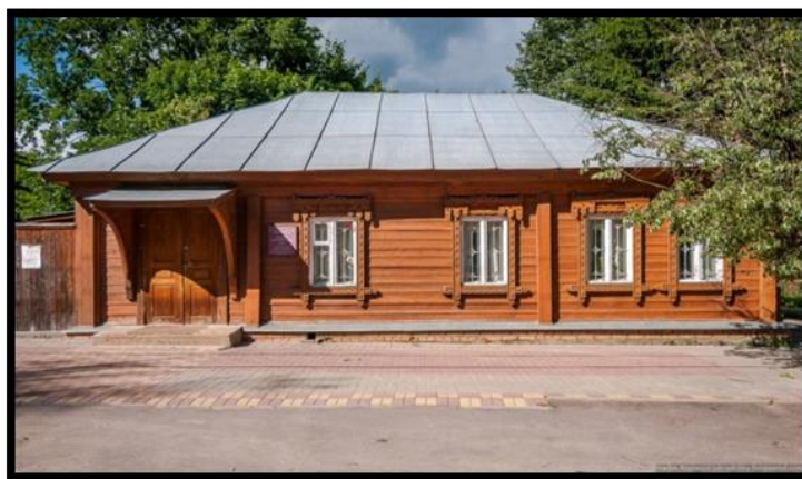
Рисунок 9. Дом «Тьо»

По воспоминаниям Анастасии Цветаевой, это была усадьба с огромным яблоневым садом, ягодами, с липовой аллеей, сиренями и огородом. Домик в семь комнат, с террасой, сходный с поленовской картиной «Бабушкин сад». В доме ласково встречали любимых внучек, здесь их всегда ждали «коробки шоколадных конфет, жареные цыплята, сдобные пирожки» (А. Цветаева).