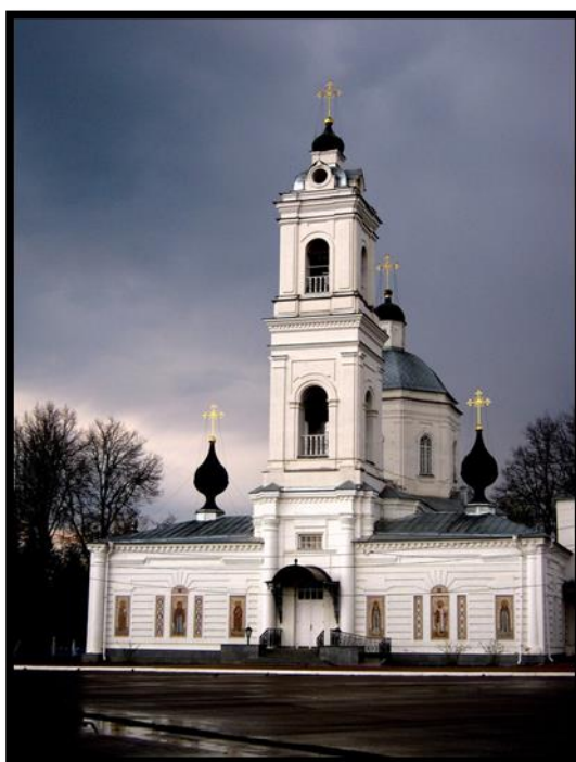
Рисунок 4. Храм Петра и Павла в Тарусе

А к 114 годовщине (2006 г.) со дня рождения поэта, на высоком берегу Оки, за храмом Петра и Павла, построенном в 1790 году, установлен памятник М. Цветаевой.