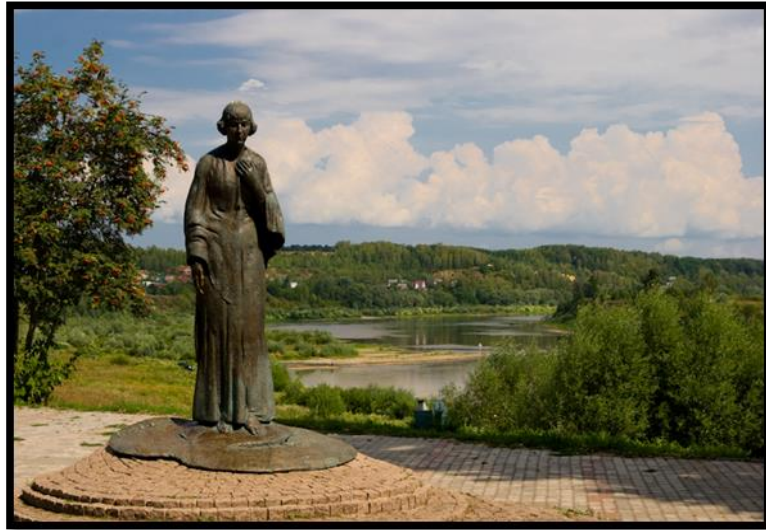
Рисунок 5. Памятник М.И. Цветаевой

Идея создания памятника принадлежала художнику Борису Мессереру, который считал, что «на этой земле должен стоять памятник М. Цветаевой». Этот замысел был воплощён скульптором В. Соскиевым. Памятник М. Цветаевой стоит на живописном месте, откуда открываются окские дали, которые придают особую пронзительность образу поэта-скитальца. В длинном платье, словно в рубище, босая, она продолжает свой путь вдоль Оки. Фигура поэта воплощает духовную мощь, когда земное отступает, и «тело, проникнутое энергией духа, становится духовным» (Блокина).