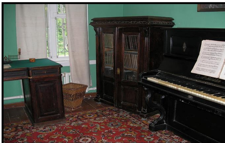
Рисунок 13. Экспозиция музея Цветаевой в Тарусе

Сейчас это музей. Здесь много подлинных вещей: туалетный столик из ореха выдаёт прекрасный вкус его хозяйки, в витринах-посуда, личные вещи Марины Ивановны, её сестры и дочери, в шкафах – прижизненные издания книг Цветаевой («Тарусские друзья Марины Цветаевой»).