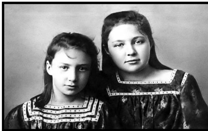
Рисунок 6. Сёстры Ася и Марина Цветаевы

Идея создания памятника принадлежала художнику Борису Мессереру, который считал, что «на этой земле должен стоять памятник М. Цветаевой». Этот замысел был воплощён скульптором В. Соскиевым. Памятник М. Цветаевой стоит на живописном месте, откуда открываются окские дали, которые придают особую пронзительность образу поэта-скитальца. В длинном платье, словно в рубище, босая, она продолжает свой путь вдоль Оки. Фигура поэта воплощает духовную мощь, когда земное отступает, и «тело, проникнутое энергией духа, становится духовным» (Блокина).