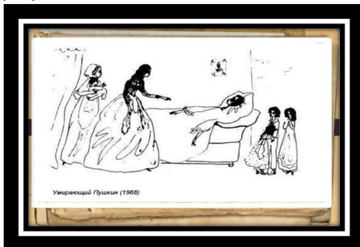
Рисунок 3. Н. Рушева из цикла «Пушкиниана»

До сих пор исследователи изучают документы, чтобы реконструировать историю любви века, которая привела к трагическому исходу: дуэли и гибели поэта.