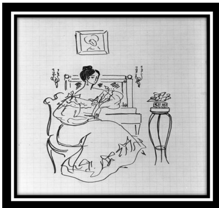
Рисунок 4. Н. Рушева из цикла «Пушкиниана» Чувство, изменившее жизнь А.С. Пушкина, определило и наше представление о любви, семейном счастье, долге, чести, достоинстве.