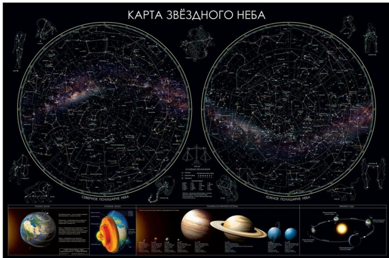
Рис.1 Пример карты звездного неба

Если все варианты одновременно не помещаются в окно браузера, можно воспользоваться сочетанием клавиш ctrl + (-) ( cmd + (-) для Mac) для уменьшения масштаба окна