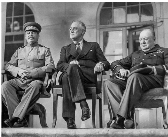
И. Сталин Ф. Рузвельт У. Черчилль