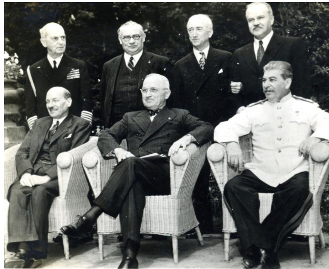
К. Эттли Г. Трумэн И. Сталин