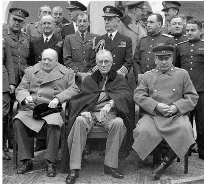
У. Черчилль Ф. Рузвельт И. Сталин