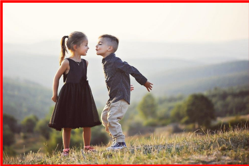
Photo 2 depicts two seven-year-old children who are walking in the dry field.

Photo 1 shows elderly people who are strolling in the streets of the modern city.