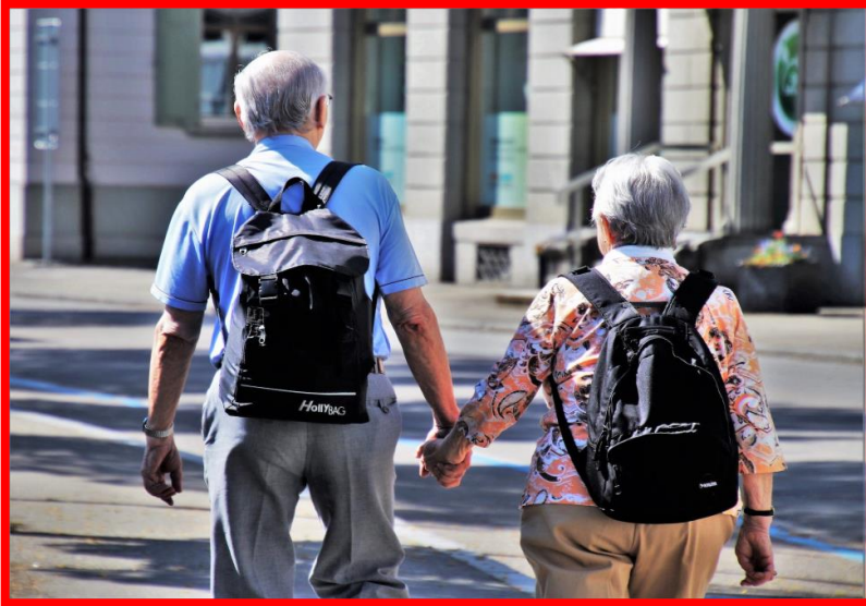
Photo 1 shows elderly people who are strolling in the streets of the modern city.